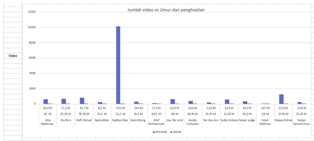
GRAFIK 3.3 TINGKAT KEPOPULERAN TERHADAP USIA PRODUKTIF

Grafik 3.3 menunjukkan tingkat kepopuleran terhadap usia youtubers. Meskipun dalam grafik tersebut Atta Halilintar memiliki usia produktif dari pada yang lainnya, tetapi dia memiliki subscriber yang paling banyak dari pada Deddy Courbuzier yang lebih tua dari dia tetapi subscribernya sedikit.